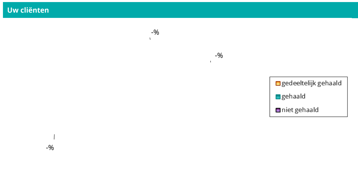
Figuur 9 Behaalde behandeldoelstelling

Figuur 9 geeft aan in hoeveel procent van de gevallen de vooraf met cliënt overeengekomen behandeldoelstellingen na afronden van de behandeling zijn gehaald. Bij gedeeltelijk gehaald en geheel gehaald kan gesproken worden van een succesvolle behandeling.